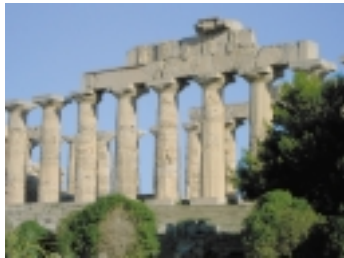
Nur gute Architektur gibt schöne Ruinen – das beweisen hier die Tempel von Selinunt