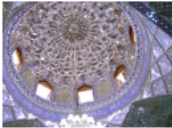
Moschee in Isfahan