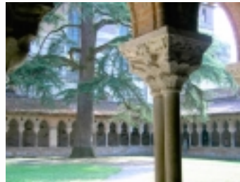
Kreuzgang in Moissac