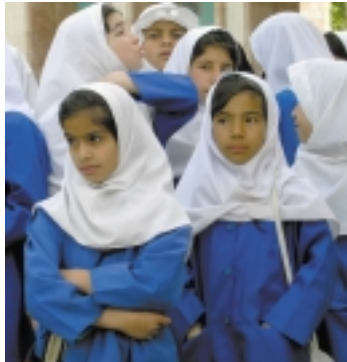
Schulmädchen in Shiraz