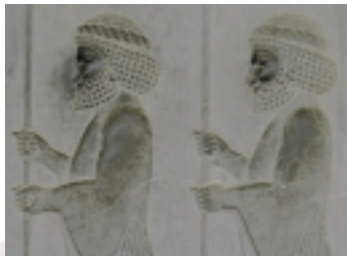
Lanzenträger. Relief in Persepolis

Die berühmten „Sonnenflecken“ in Ste. Madeleine zu Vézelay (Burgund) am Johannistag