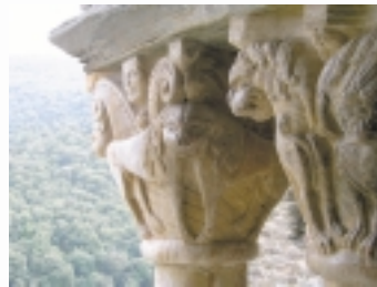
Ungezählt sind die herrlichen romanischen Kapitelle in