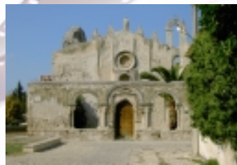
Ein Traum in Mosaik – die Martorana in Palermo