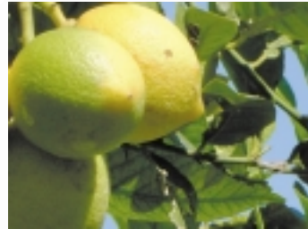
Hier reifen die Demeter-Zitronen der Salamita-Plantage